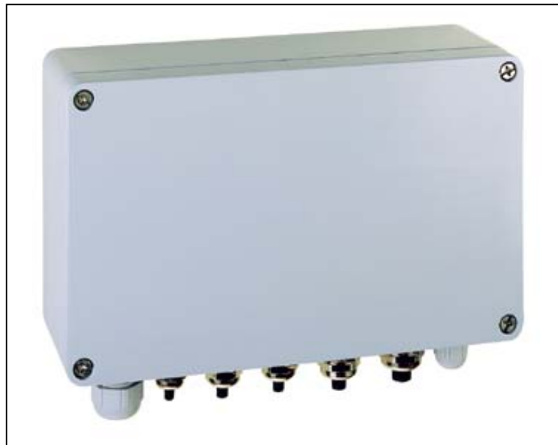
Abb. ähnlich / fig. sim.